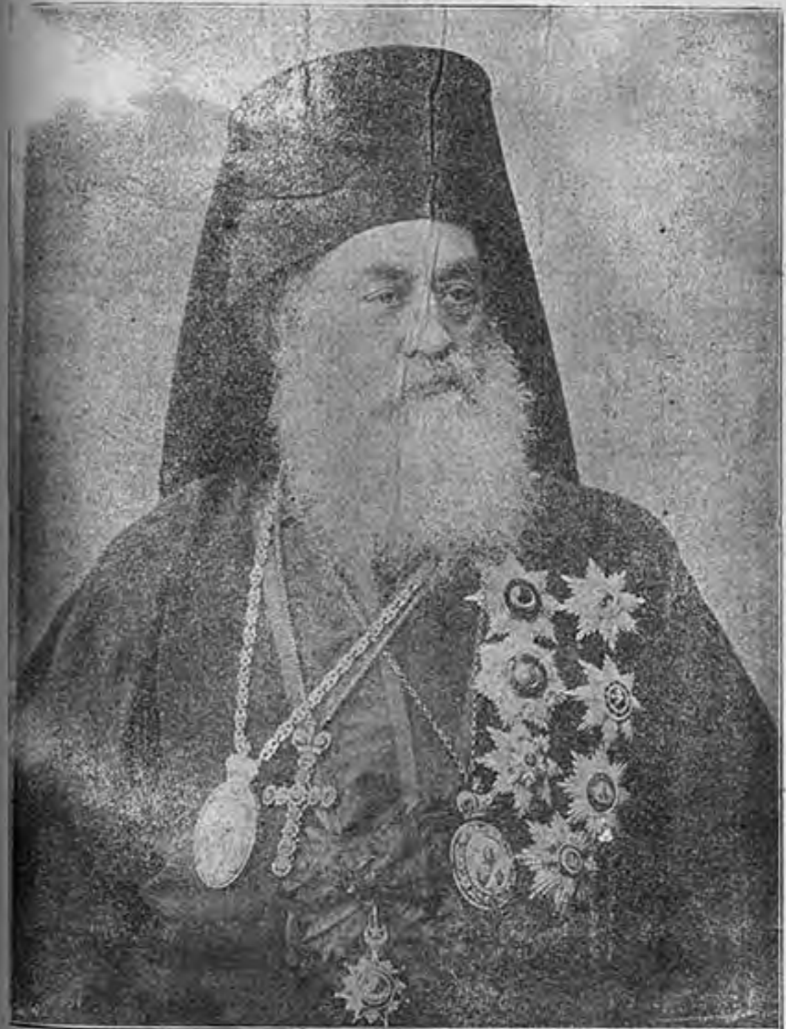
Η Α. Θ. Π. Ο ΟΙΚΟΥΜΕΝΙΚΟΣ ΠΑΤΡΙΑΡΧΗΣ ΙΩΑΝΝΗΣ Γ'

Ἐάν δὲν ἀγοράσετε κασ- μίρα, καπέλλα, ὑποκάμι- σα, κολλάρια, γραβάτες, γα- λότρες, ὀμβρέλες καὶ κασκέ- τα, = ΚΟΥΡΑΧΑΝΗ μὲ ἄφθοστον Εὐρωαῖκόν Γού- στο θὰ ΜΕΤΑΝΟΗΣΕΤΕ