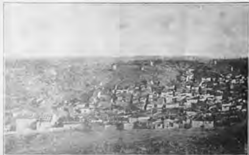
ΑΝΑΤΟΛΙΚΗ ΣΥΝΟΙΚΙΑ ΚΥΔΩΝΙΩΝ - ΤΣΙΓΓΑΡΙΑ