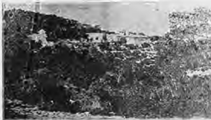
Ἡ ΜΟΝΗ ΤΗΣ ΖΩΟΔΟΧΟΥ ΠΗΓΗΣ - ΕΝ ΣΑΜΩ

Ἐπίσης ἀναγράφονται μεταξὺ τοῦ σκῆθου ἡμῶν ἐρίζοντες ἀφίπτοντες, ὅν ἡ ὑπάρξει εἶνε ἐφήμερος ἢ μάλλον στιγμιαία ἀναγράφονται ἔμως καὶ τινες ἀκτινοβόλοι ἀστέρες, ὅν ἡ λάμψις οὐ μόνον γλυκεία καὶ ζωογόνος τυγχάνει ἐπὶ τῆς ὑψηλοῦ ἀλλὰ